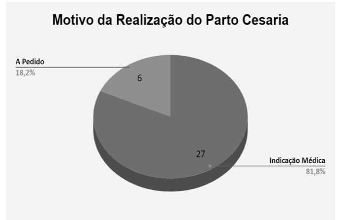
Figura 3: Motivo da realização do parto cesárea

Preferência e satisfação pela via de parto... estar satisfeitas e 5 ficaram insatisfeitas. A Figura 3 demonstra graficamente os motivos de realização do parto cesárea.