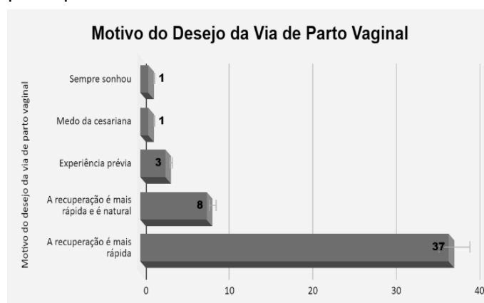
Figura 1: Motivo do desejo da via de parto vaginal das participantes.

Assim, também foi analisado e questionado sobre o desejo da via de parto das participantes, dividindo entre parto normal e cesáreo, além dos motivos que levaram as participantes a decidirem por um dos dois. Dessa forma, 50 (69,4%) das participantes optaram pelo parto vaginal. Dessas, 45 disseram que o motivo da escolha seria devido a recuperação ser rápida. A Figura 1 ilustra em um gráfico os motivos pela escolha do parto vaginal.